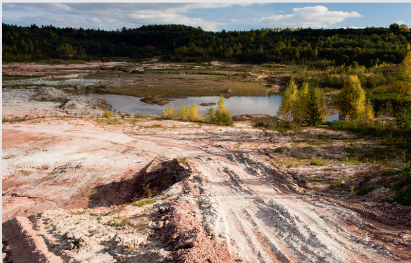
Lodes mālu karjers

Pievērs uzmanību! No avotiem iztekošajos strautos, pie alu ieejām un smilšakmens atsegumiem redzamas brūnas gļotas – dzelzs baktērijas. Klinšu piekājē – satrupējušas liela mēroga kritālas un sausokņi, kuros dzīvo dažādas vaboļu sugas, vārpstīngliemeži. Redzami dzeņu un dziļnu kalumi. Uz atsegumiem – vientuļo bišu kolonijas, dažādas sūnu (mēlītes vijzobe, parastā konusgalvīte u.c.) un ķērpju (krevu ķērpji, melnā cistokoleja, peltīgeras u.c.) sugas, saldsaknītes, trauslās pūslīšpapardes, paceplīša ligzdošanas vieta. Apkaimē – piemērota sēņu vērošanas vieta.