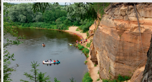
Ērgļu (Ērģeļu) klintis