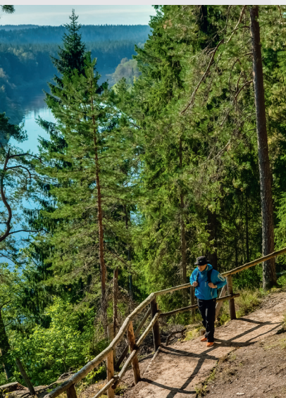
Takas pie Sietiņieža