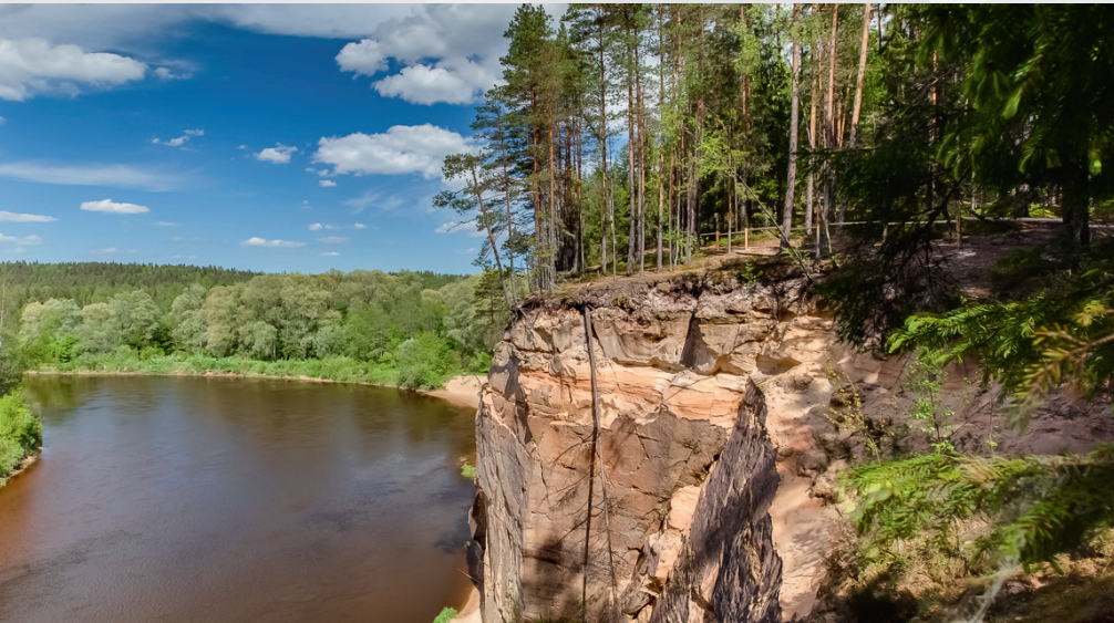
Ērģļu (Ērģļu) klintis