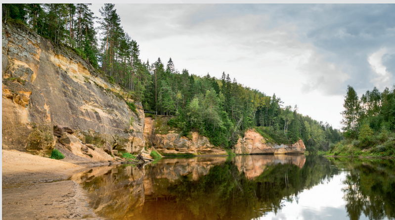
Ērģļu (Ērģeļu) klintis