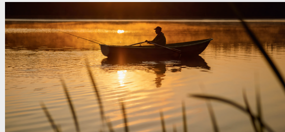
Raiskuma ezers saulrietā