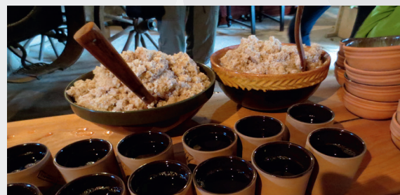
Maltīte Āraišu ezerpilī