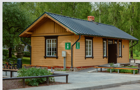
Līgatnes novada Tūrisma informācijas centrs

Atklātāka vieta Dārza ielas malā, kas pēc izcelsmes ir Gaujas senlejas kreisā pamatkrasta nogāze. Agrākos laikos šeit bija govju ganības. No šejienes paveras plašs skats uz Gaujas senlejas pusi.