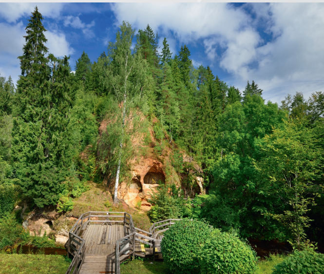
Lustūzis jeb alu iezis