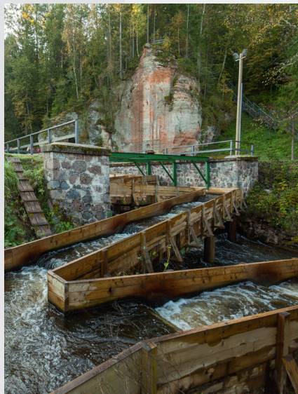
Zivju ceļš