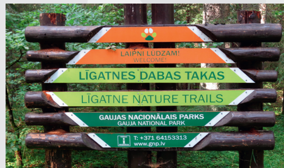
Līgatnes dabas takas